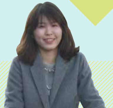
黄さんの一日 from 台湾