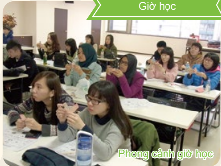
Phòng cảnh giờ học