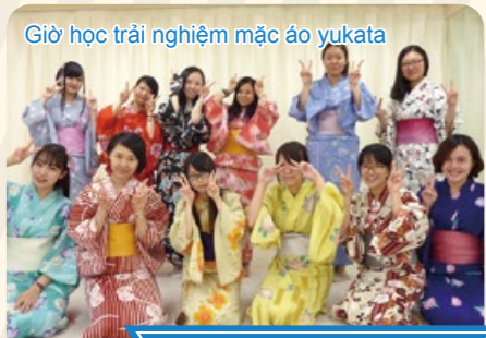
Giờ học trải nghiệm văn hóa