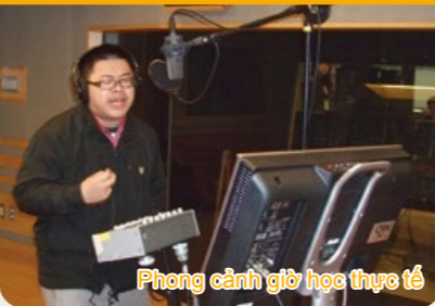
Phòng cảnh giờ học thực tế