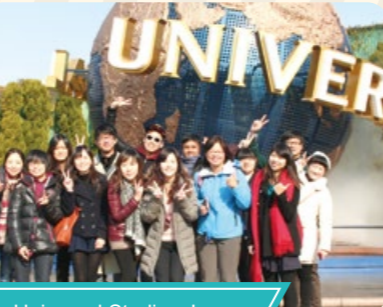
Universal Studios Japan